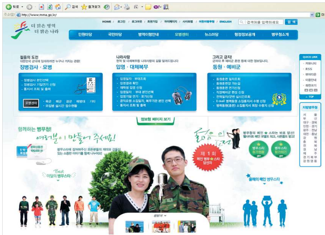
병무청 홈페이지 www.mma.go.kr

병무청은 지난해 말 CMS와 검색엔진, 로그분석 솔루션이 통합된 IWS(I-ON Web Analytics Server)를 도입해 홈페이지를 재구축, 성공적이라는 평가를 듣고 있다. 그 이유가 무엇인지 현장을 직접 찾아가 봤다. 김소연 기자 soy@itdaily.kr